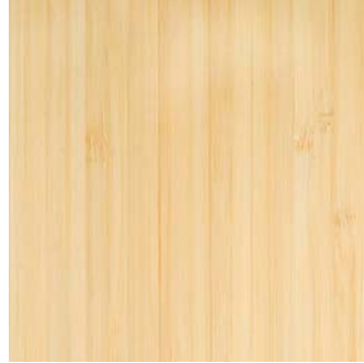
MADERA DE BAMBO