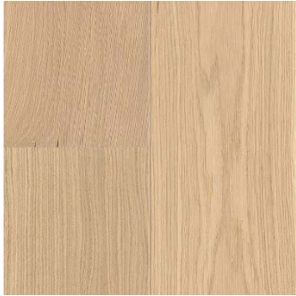
MADERA DE ROBLE